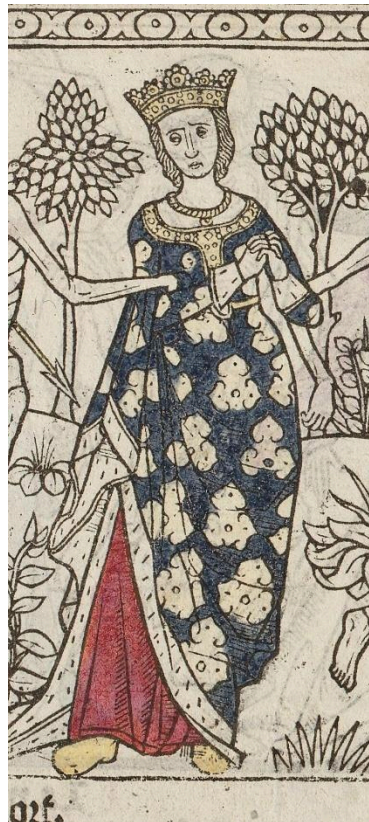
Figura 3: a Rainha, da Danse macabre des femmes

Fonte: MARCHANT, Guyot. La danse macabre des femmes . Paris, 1491. Impresso.