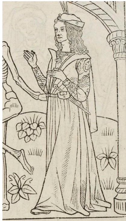
Figura 4: O Amoureux da dança macabra de 1486.