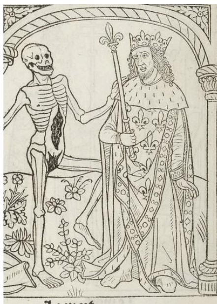
Figura 2: O Rei, na dança macabra de 1486.

Fonte: MARCHANT, Guyot. Miroir salubre . Paris, 1486. Impresso. Disponível em: https://gallica.bnf.fr/ark:/12148/btv1b8615802z/f12.item#