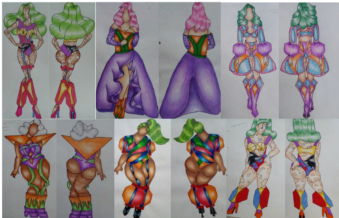
Figura 4: Seis dos 20 croquis comerciais.

Tal como nos croquis conceituais, nos comerciais contemplamos a diversidade de corpos, com modelos plus size , magras e mendum size , mulheres pretas, brancas e com vitiligo, bem como com cabelos de diversos comprimentos, formas e cores. Nos seis looks é predominante a cor lilás e as formas pontiagudas, sendo nos ombros ou bustos.