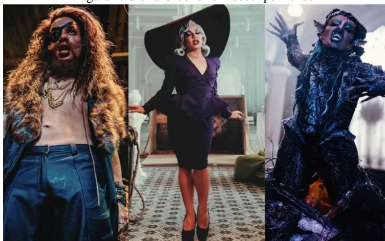
Figura 1: Gloria Groove no videoclipe 'Leilão'

em contraste com a imagem feminina. No videoclipe da música 'Leilão', Groove trouxe imagens das vertentes da arte drag king , queen e monster .