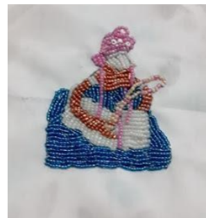
Figura 2: Bordado do orixá Nanã.