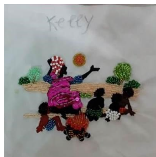
Figura 1: Bordado da Princesa Angolana.