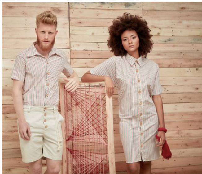
Figura 2: Peças da marca 'Thear'