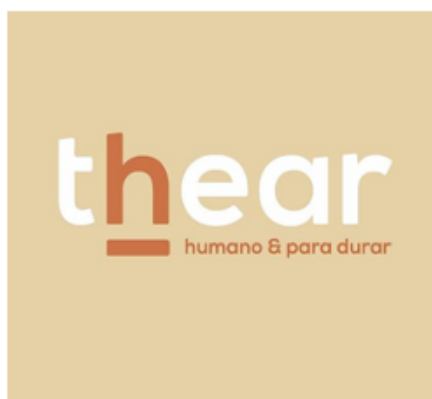
Figura1: Logomarca 'Thear' e como marca mostra seus processos e materiais nas redes sociais.

E nessa busca por produtos sustentáveis que encontramos marcas que trabalham o conceito do slow fashion como a Thear (figura 1 e 2). uma marca goianiense, produzindo roupas com tecidos 100% algodão, além do cuidado de utilizar linhas de algodão e aviamentos naturais, como botões de madeira. Explorando meios sustentáveis para repensar os processos produtivos, utilizando de resíduos da sua própria produção no design de superfície, reduzindo os impactos ambientais. Além disso, a Thear traz em suas peças a memória afetiva, o feito à mão, valorizando cada vez mais as pessoas envolvidas.