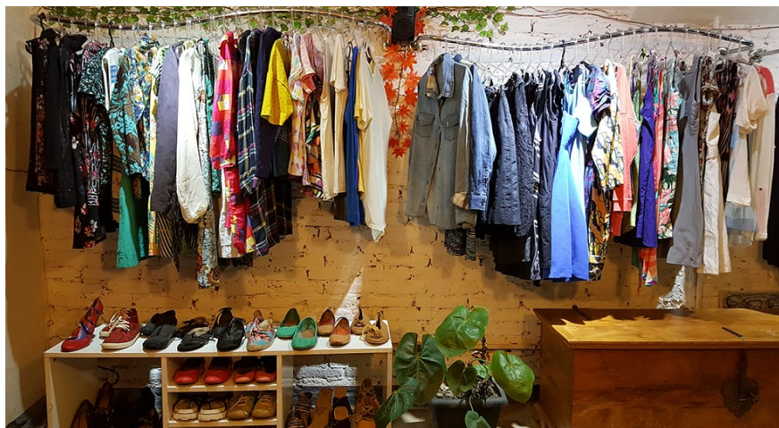
Figura 3: Interior da loja Empório Armário