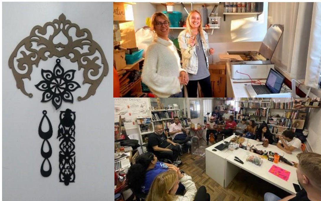
Figura 4: Oficina de corte à laser