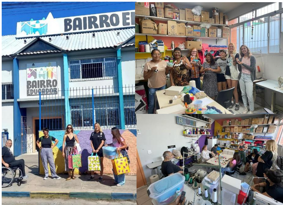
Figura 3: Oficina de feltragem

possui uma sala de aula, e foi dividida em dois dias de atividades. A equipe do NASDesign-UFSC se deslocou até o local, de modo a concentrar as atividades junto à comunidade (Figura 3).