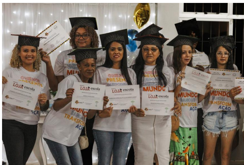
Figura 1: Turma de mulheres em formação, AMMO