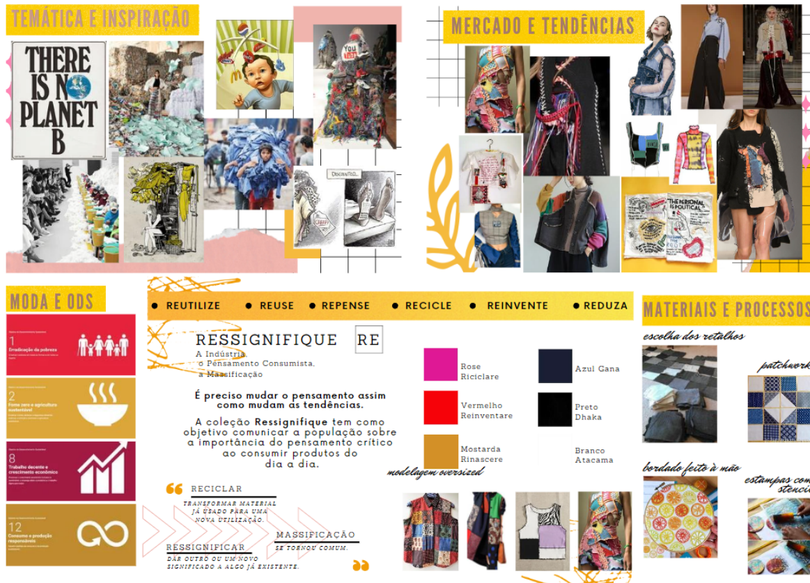
Figura 2: Visualização conceitual apresentada por um grupo de estudantes

Fonte: Material produzido para a atividade, 2022.