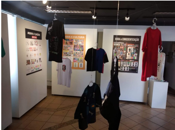
Figuras 4 e 5: Exposição TSURE - Você veste suas escolhas?