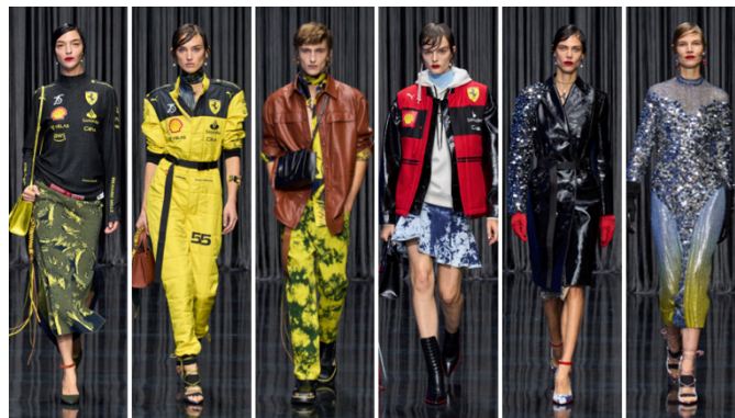
03 – Desfile da coleção Primavera 2023 da Ferrari

e luvas esportivas em contraste, como visto na figura 03.