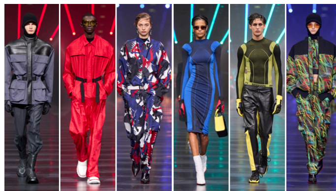
Figura 02 - Desfile da coleção Outono 2022 da Ferrari

No início de 2022, Ferrari lançou sua segunda coleção. Enquanto a primeira focou nos componentes dos carros, a coleção Outono 2022 se inspirou nos aspectos tecnológicos por trás da marca. Estampas com padrões coloridos foram inspirados nos testes realizados pela Ferrari em seus veículos. Além disso, macacões de seda representavam os pilotos de corrida e os mecânicos da escuderia. (PHELPS, 2022). A imagem a seguir (Figura 02) representa alguns looks desfilados pela marca.