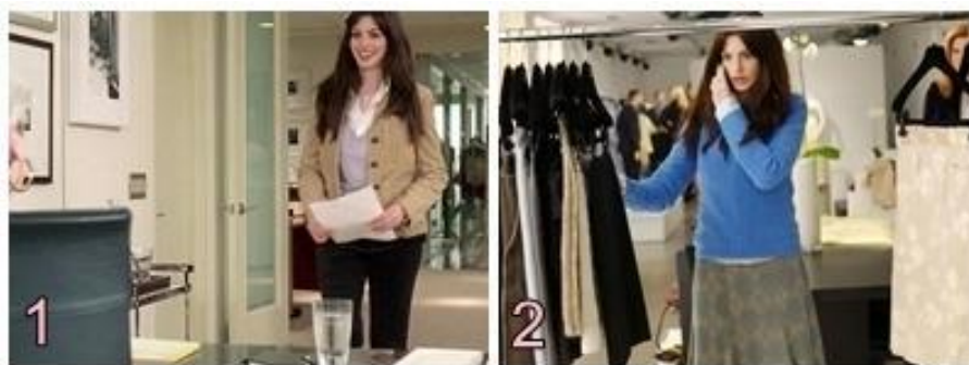
Figura 1 - Início da jornada e Apresentação da problemática