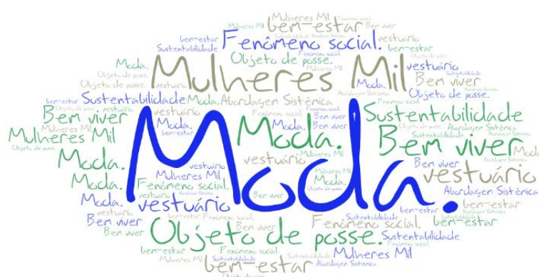
Figura 10 - nuvem de palavra construída pelas alunas do PPM, edição/2022.

Em se tratando da sustentabilidade, termo bastante abordado no curso, compreendemos que a moda e a sustentabilidade são temas que estão cada vez mais interligados, pois busca promover uma moda mais consciente e responsável, levando em consideração o impacto ambiental e social de toda a cadeia produtiva. Nesse sentido, construímos uma nuvem de palavras com termos, temas e assuntos abordados no curso.