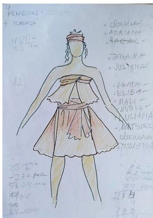
Desenho de J. Cunha para a Dança da Água

Percebemos uma predominância da calça estilo saruel, cuja origem africana é pouco conhecida, sua utilização adveio das pesquisas feita pelo figurinista sobre as vestimentas africanas, trouxe essa referência ao espetáculo, e também possibilitou a mobilidade e amplitude dos movimentos das danças. As rendas colocadas nos figurinos da cena final remetem à colonização.