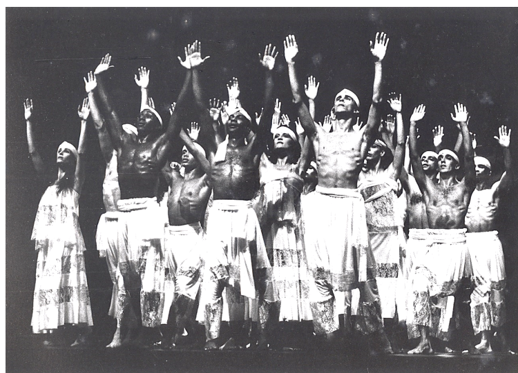
Traje corte de Oxalá - calça e adê