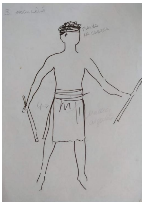
Desenho de J. Cunha para a Dança do Fogo

Outro figurino que elencamos é o da Dança das águas, este faz alusão a Iemanjá, e a as danças possuem elementos que remetem ao arquétipo da orixá, assim como todos os outros das cenas que compõem o espetáculo. Este figurino traz referência a África através da utilização dos guizos nas mãos e nos pés dos dançarinos, eles conferem sonoridade a peça. Além desse elemento as bailarinas dançam com um chocalho de peneiras, que são duas peneiras justapostas com guizos ou tampinhas no seu interior, o que conferia sonoridade ao figurino e remetia ao barulho do mar. As peneiras assim como os guizos são elementos marcadores de ritmo, e a utilização da peneira remete ao folclore brasileiro, que se utiliza de elementos de uso cotidiano nas suas manifestações populares.