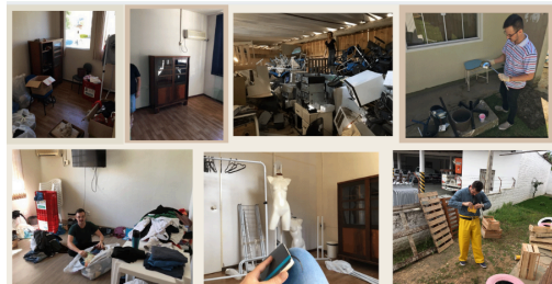
Figura 2: Processo de escolha do espaço e organização das peças e objetos