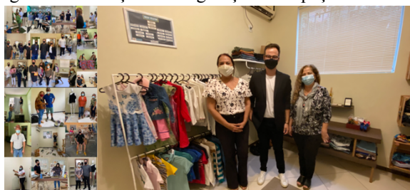
Figura 4: Cocriação e Inauguração do espaço Bem Vestir