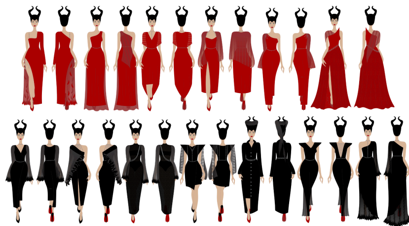
Figura 1: painel de modelos da coleção Escuridão.

(no caso do look principal), tem-se alguma harmonia. Assim, treze looks foram criados para coleção Escuridão conforme exhibe a figura 1.