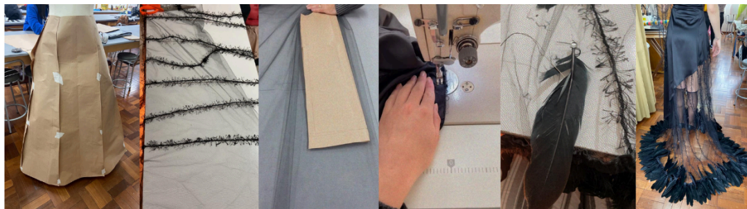
Figura 2: painel composto de registro do processo de produção.

Treptow (2013, p.151) intitula essa etapa como desenvolvimento. O princípio foi a modelagem plana do tronco, seguido da moulage com papel da saia e aplicação da linha felpuda no tule. Após a modelagem pronta, o new spam e o tule foram cortados. Em seguida, o tronco com forro de mesmo tecido foi entretelado e todas as partes foram costuradas, o zíper invisível foi aplicado na lateral e as penas e chatons começaram a ser pregados à mão.