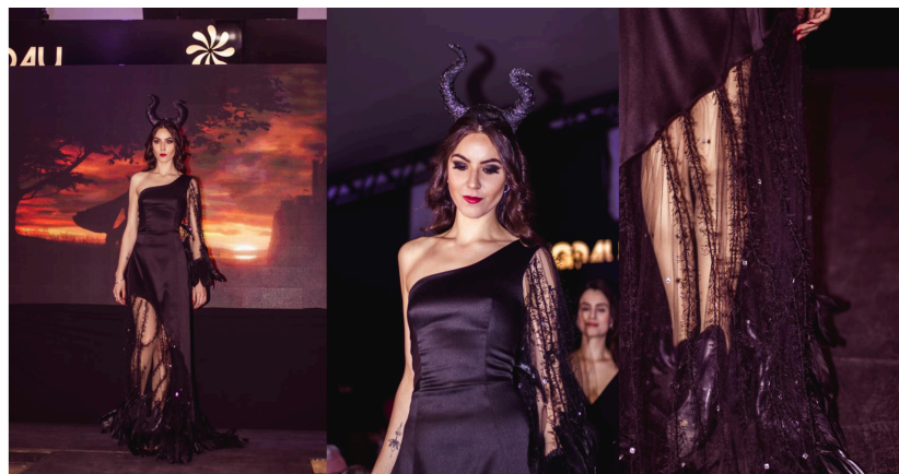
Figura 3: painel de registros do desfile Fashion Première 2022 .