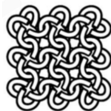
Figura 2: vários links