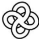
Figura 1: link de quatro elos

Na sequência do processo, o arquivo digital é processado pelo software de impressão 3D, onde ‘é cortado em fatias de 0,1 mm e cada fatia digital é enviada para a máquina AM e desenhada pelo laser na camada de pó de nylon. Cada camada é processada em sequência, uma de cada vez, para construir a pilha completa’ (BLOOMFIELD e BOSTROCK, 2018, p. 5, tradução literal). O nylon, por sua vez, pode ser tingido por corantes utilizados pela indústria têxtil.