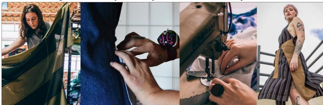
Figura 2 - Processo produtivo e produto final da marca Farrapo Couture

Fonte: https://www.farrapocouture.com.br Adaptado pela autora (2021).