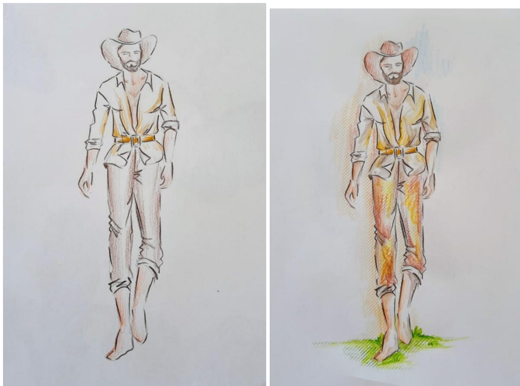
Figuras 01 e 02 – Homem branco trabalhador das minas

Fonte: Esboço da autora, Nélia Finotti e aperfeiçoamento do artista Edson Arruda, 2021.