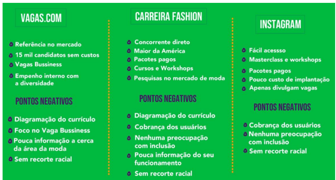
Figura 1: Painel com pontos positivos e negativos das concorrentes.

Os pontos relevantes levantados nas análises foram considerados e adicionados como um diferencial para a atração de clientes para a plataforma. Todas as pesquisadas que possuem uma plataforma e geram currículos automáticos em seu site não possuem preocupação na diagramação e design do currículo. Além disso, nenhuma das empresas realizam recorte de raça na disseminação dos currículos, com a intenção de igualar as oportunidades e criar atalhos para os obstáculos sociais que o indivíduo negro sofre quando busca se inserir no mercado de trabalho.