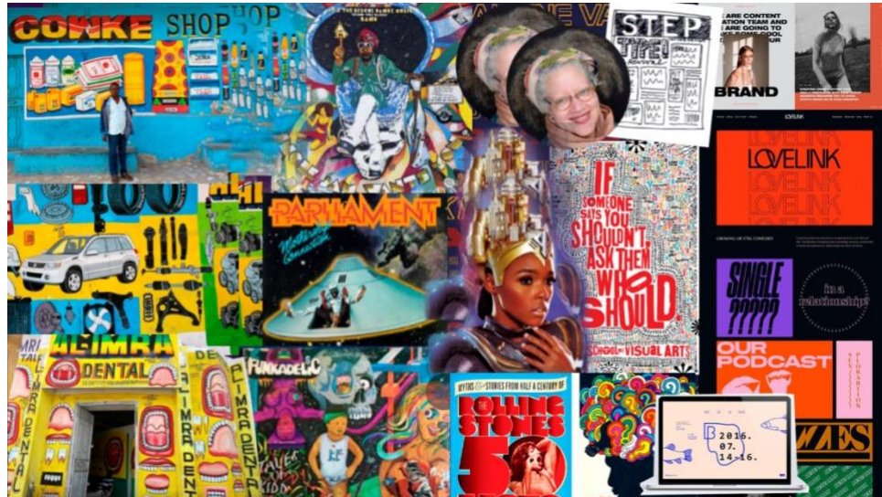
Figura 3:

Carregada de material referencial iniciou-se o processo de testes, rascunhos e croquis para compreender como cada elemento seria traduzido e como seria aplicado de forma funcional para um site de recrutamento.