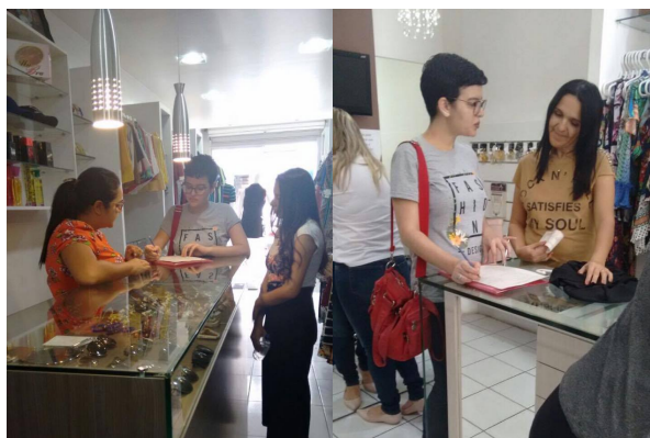
Figura 1: Aplicação de questionário nas lojas de Caicó

Durante a execução do projeto, foram feitas pesquisas online (netnografia) para identificar macrotendências globais e também uma pesquisa de campo com aplicação de questionário no comércio local da região central da cidade. Ao todo foram visitadas 80 lojas de moda feminina e aplicados questionários em 10 delas (figura 1), e a pesquisa de campo também se complementou através da observação não participante em espaços públicos coletivos, para delimitação dos grupos de gosto locais. Paralelo a isso, identificou-se 6 macrotendências globais de consumo e comportamento com traços de desdobramento na realidade local. O material desenvolvido foi apresentado e disponibilizado aos lojistas através de um seminário, realizado em 23 de novembro de 2017, no auditório da Câmara dos Dirigentes Lojistas da cidade de Caicó (figura 2). Os resultados obtidos também foram apresentados em eventos científicos nacionais e internacionais.