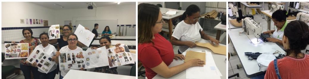
Figura 4: Cursos ministrados pelos alunos do Design de Moda às alunas egresso do programa Mulheres Mil

Percebeu-se que algumas das alunas egresso do programa terminavam o curso e gostariam de continuar com sua formação e convívio no ambiente escolar. Desse modo surgiu a demanda de ofertar novos cursos, de curta duração e com temas relacionados ao fazer profissional que elas haviam acabado de adquirir (elaboração de painéis de inspiração, modelagem de bolsas, modelagem zero resíduos, e cálculo de preço de produto). Os temas, conteúdos e materiais dos cursos foram desenvolvidos pelos alunos do curso de Design de Moda, como também as aulas foram ministradas por eles, conforme apresenta a figura 4. A experiência foi bastante exitosa, pois estimulou o convívio entre alunos de diversos níveis de conhecimento, a troca de experiência e saberes empíricos e populares e o trabalho em equipe, habilidade indispensável para profissionais da indústria criativa (TREPTOW, 2013).