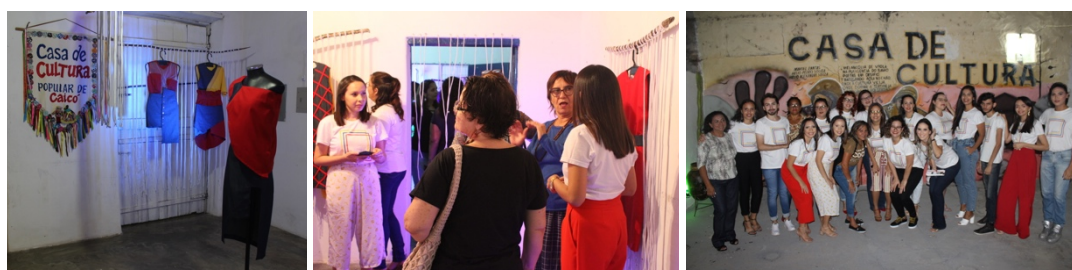
Figura 6: Evento de lançamento da coleção Primária

A coleção foi apresentada em formato de exposição no dia 12 de dezembro de 2018, na Casa de Cultura de Caicó (figura 6). O evento, aberto ao público, também teve por objetivo relatar todo o trabalho realizado e apresentar à cidade todos os envolvidos, enquanto profissionais aptos a ingressar no mundo do trabalho. Os resultados foram divulgados na imprensa local e também em eventos científicos.